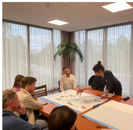
Impressie van de plenaire presentatie (links) en deelsessies (rechts)